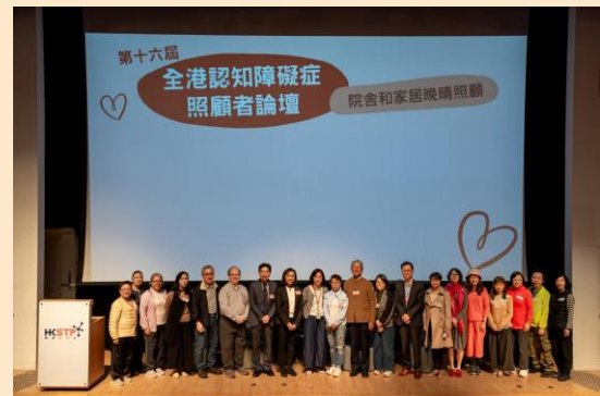
▼ 分享嘉賓與聯盟委員會合照

聯盟全賴各界友好的鼎力支持和積極參與，你們無私的奉獻，抱著「有錢出錢、有力出力」的精神，不但讓各項活動得以圓滿成功地舉行，更是響應政府及社會同心「齊撐照顧者行動」的有力證明。