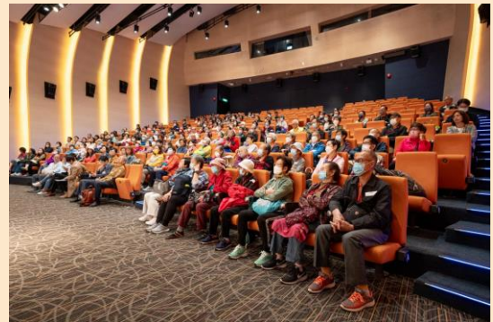
▲ 現場超百人參與是次論壇盛事