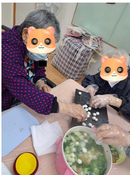
▲長者參與日間認知訓練活動

由於往日他們經常到長者中心參加活動，我便叩門向中心社工查詢詳情。經過幾次家訪及評估後，社工幫我們父母申請輪候入住護老院。大約半年後，社工主動聯絡我們，介紹社署正推行「長者社區照顧服務券試驗計劃」，此計劃可提供「日間護理中心服務」及「家居照顧服務」。協助我們的社工亦有提供各種支援服務的資訊給我們參考。我們經過社署審批而被評定為合資格參加該社區券試驗計劃。自此以後，媽媽每星期都參加仁愛堂歐雪明腦伴同行中心的日間認知訓練活動，讓她的認知功能保持靈活，又能增進社交活動，保持與外界接觸。爸爸因年老體弱，行動不便，每次沖涼也很困難。我們便向附近護老院申請到戶沖涼服務，可惜因為父母住的舊式公共屋邨設計上的問題，職員最終未能提供到戶服務。