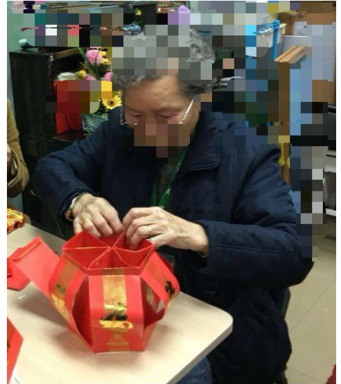
▲長者親自製作傳統掛飾

當年我家的工人姐姐報讀了一個由衛生署舉辦的外傭護老者培訓課程，費用全免。課程內容主要教授護老者如何照顧臥床及行動不便的長者，讓工人姐姐學習一些日常照顧長者的技巧，例如量血壓、扶抱、換尿片、洗澡、餵食等，以及介紹復康及輔助用具，對於照顧我家的老友記確是有幫助的，亦可以讓家屬減省時間教她們照顧技巧。不過，如何處理認知障礙症患者的行為及心理症狀，課程內容探討不足。課程完畢時，工人姐姐會獲發一張畢業證書。