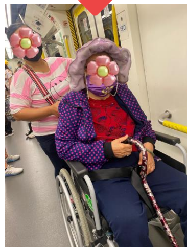
▲外傭與長者一同外出

媽媽在2020年中風後行動不便及引發腦退化和抑鬱症等後遺症。由於家中無人接受過相關的專門照顧訓練，亦未認識到社區支援服務的資訊，當時我們深感徬徨無助。兄弟姊妹經協調後，大家決定輪替照顧年邁雙親。不過，因為各自有家庭負擔，實在不能長期全職照顧父母，當時又正值疫情爆發期間，幾經轉折才聘得外籍家傭協助照顧兩老起居飲食及操持家務，照顧壓力稍微減輕。此外，我們考慮到一個家傭照顧兩個行動不便的老人家實在吃力，經過家庭會議後，兩老也贊成申請輪候入住護老院。