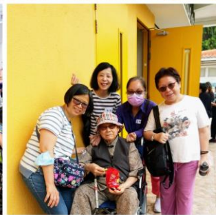
參加者、委員以及分享嘉賓留下倩影